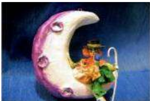
ARTESANIAS MEXICANAS "EL COLOR DE MEXICO"

El color de México le ofrece una amplia variedad de artesanías hechas en papel mache con una gran variedad de técnicas, diseños y precios para satisfacer las necesidades de nuestros clientes nacionales y extranjeros que buscan encontrar piezas con un sello característico del color y folklore de la artesanía mexicana. Estamos a sus órdenes en el interior del Centro Artesanal "La Ciudadela" en un horario de 10 AM a 7 PM de lunes a sábado y los domingos de 10 AM a 6 PM los 365 días del año. En un ambiente limpio, seguro y con los mejores precios del mercado.